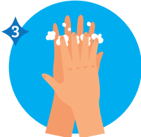
ENTRE LOS DEDOS