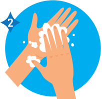
PALMA CONTRA PALMA