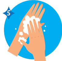
DORSO DE LAS MANOS