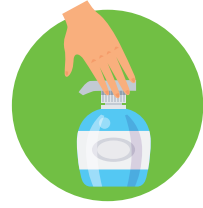
O DESINFECTATE UTILIZANDO ALCOHOL EN GEL.