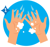
AGUA Y JABÓN

1) Lavarse las manos con agua y jabón, o desinfectarse con alcohol en gel.