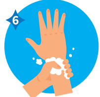
INCLUIR LAS MUÑECAS